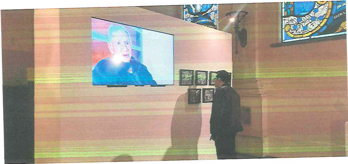
fotografía de una obra de videoarte