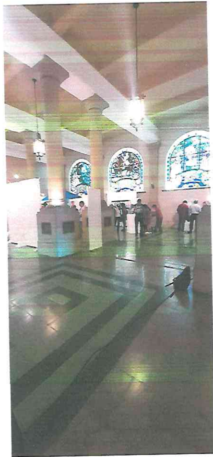
fotografía tomada al momento de ingresar a la exposición

La inauguración se llevó a cabo el día 18 de septiembre del año 2023 a las 11 de la mañana, el ingreso fue demorado pero muy ordenado, las medidas de identificación de los invitados fueron bastante eficientes, se estimó una cantidad de 60 a 75 personas, la refacción proporcionada para los asistentes fue muy apropiada y amena, la convención con los demás artistas fue increíble