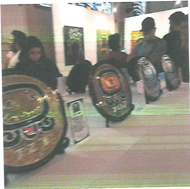
fotografía tomada a la obra de una compañera artista.