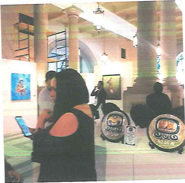
fotografía tomada a la obra de una compañera.